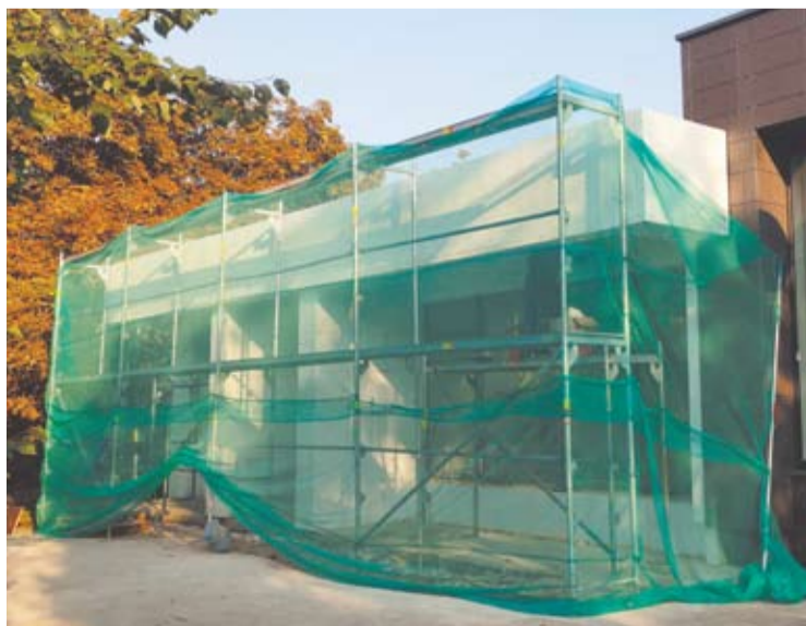
Baigiamas rekonstruoti buvusio Anykščių knygyno pastatas.

Vienas iš pastatų-vaiduoklių, esančių Anykščių miesto centre, keliamas naujam gyvenimui. Baigiamas rekonstruoti buvusio Anykščių miesto knygyno pastatas, kuriame jau spalio mėnesį turėtų pradėti veiklą Šeimos klinika.