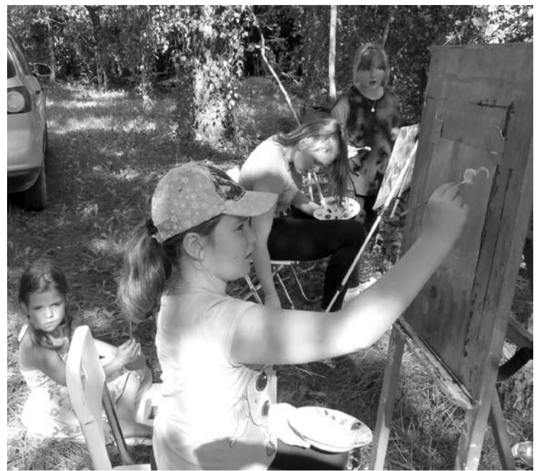
Vaikams buvo įdomu pirmą kartą tapyti gamtoje.