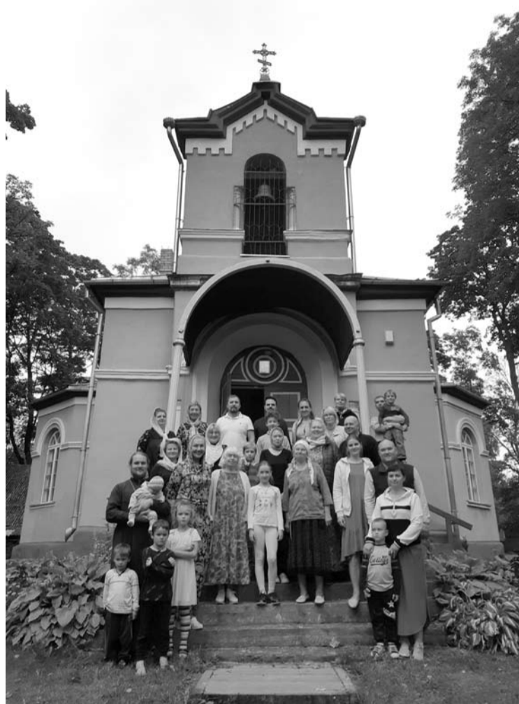
Šventiškai nusiteikę Šv. kunigaikščio Aleksandro Nevskio šventės Anykščių cerkvėje dalyviai.

Sekmadienį Anykščiuose švęsti tituliniai Anykščių stačiatikių cerkvės atlaidai - Šv. kunigaikščio Aleksandro Nevskio šventė. Pamaldose dalyvavo daugiau nei trys dešimtys vietinės bendruomenės narių bei svečių, šventės dalyviai kartu papietavo, pasistiprino gardžia žuviene, sutiko piligriminio žygio automobiliais po Lietuvos stačiatikių šventoves dalyvius.