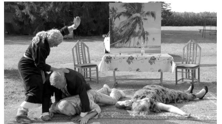
Nesudėtingo siužeto spektaklis buvo rodomas lauke, nes oras palepino labai malonia, vasariška šiluma.