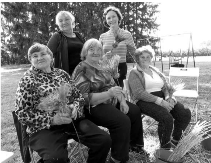
Moterys surišo po gėlę iš natūralių gamtinių medžiagų ir jautėsi daug pramokusios per vieną pusdienį.