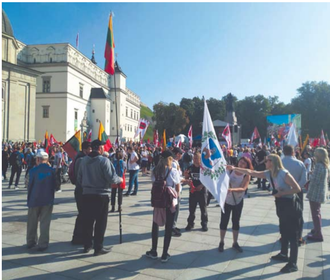
Mitinge Katedros aikštėje plazdėjo ir Anykščių vėliava

Vidmantas ŠMIGELSKAS vidmantas.s@anyksta.lt