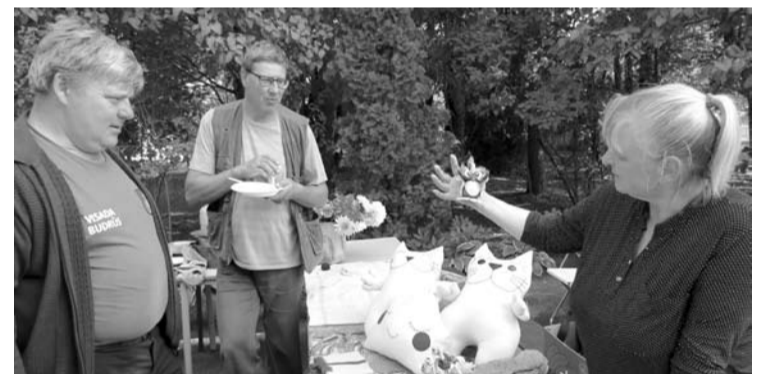
Prie buvusios Budrių pradžios mokyklos pastato vykusiaime turgelyje buvo įvairių prekių.